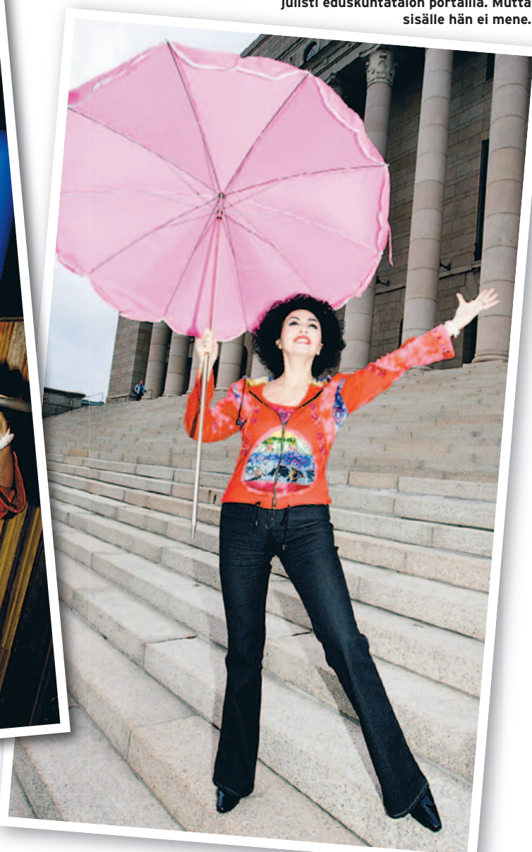
”Kansalaiset, medborgare!” Airisto julisti eduskuntatalon portailla. Mutta sisälle hän ei mene.